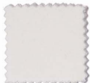
Web-Nr.: 4516 051 ecru