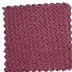
Web-Nr.: 4522 018 bordo