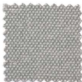
Web-Nr.: 3003 1181 hellgrau