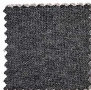
Web-Nr.: 4523 168 anthrazit