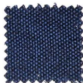
Web-Nr.: 3004 1259 dunkelblau