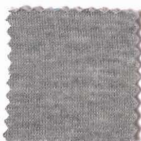
Web-Nr.: 4519 165 hellgrau