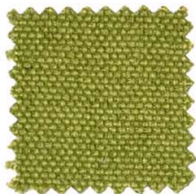
Web-Nr.: 3001 1603 kiwi