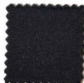
Web-Nr.: 4527 069 schwarz