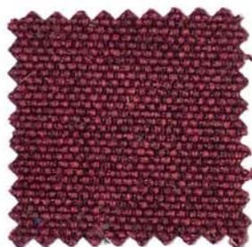
Web-Nr.: 3000 1937 bordeaux