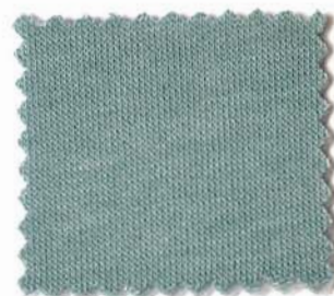
Web-Nr.: 4518 928 petrol