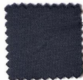
Web-Nr.: 4525 008 dunkelblau