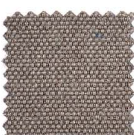
Web-Nr.: 3006 1173 beige