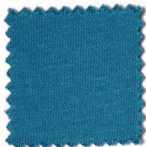
Web-Nr.: 4520 006 türkis