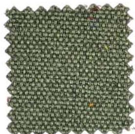
Web-Nr.: 3002 1604 moos