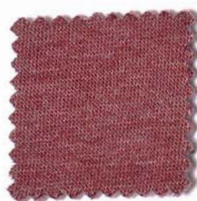
Web-Nr.: 4524 918 bordo meliert