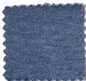
Web-Nr.: 4521 108 jeans