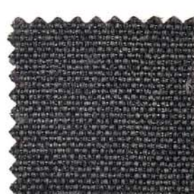
Web-Nr.: 3008 1789 anthrazit