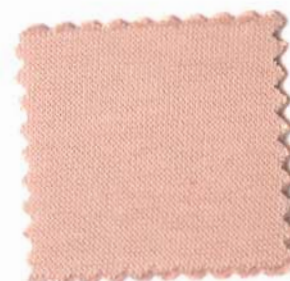
Web-Nr.: 4526 132 rosa